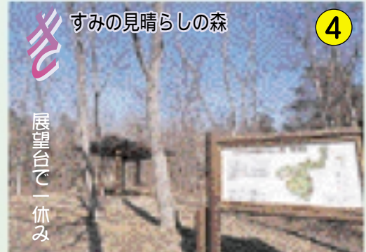
4 すみの見晴らしの森