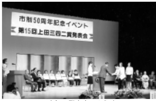
昨年の発表会のようす

発表会では、入賞者の発表および賞の授与が行われ、引き続き記念講演、優秀作品の選評が行われます。多数のご来場をお待ちしています。