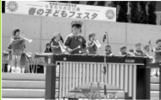
前回の子どもフェスタから

日時 5月29日(日) 10時から15時頃まで 内容(内容の変更あり) ハートフルステージゾーン 元気いっぱいのこどもたち がステージ上で踊り、音を奏でてひまわりの丘公園は大にぎわい。景品引換券入りのもちまきやビンゴゲームなどもあり、目が離せない注目のゾーン。 ふれあい屋台村ゾーン 地元の各種団体のご協力によりイベントを「食」で演出。あんぱん・ドーナツ、おにぎり、いそべ焼、ベトナム風お好み焼きで、一日を楽しむパワーを蓄えていただきます。お土産にぴったりの手作り工芸販売コーナーもあります。 チャレンジゾーン 遊びの素を作ってみよう！