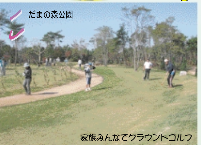
14 こ だまの森公園

7世紀後半頃に建立された古代寺院跡で、東西両塔、金堂、講堂などが確認され、奈良の薬師寺と同じ伽藍配置であったことが明らかになっています。建物が約20分の1で復元されています。