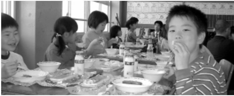
学校給食で「おのっ子パン」を食べる児童ら

作品では、地元産の酒米「山田錦」で作っている酒米パン（おのっ子パン）を題材として、小野市の特徴（よさ、オリジナリティー）を子ども達に分かりやすく伝えることを目標としました。作品は、「行政」（農政課、給食センター）「民間」（パン工場、ひまわりの丘公園パン工房）「学校」（給食の様子、児童の反応）など、それぞれの役割がバランスよく構成されており、「三者の横断的な努力や苦労をつましく表現している。」と高く評価されました。