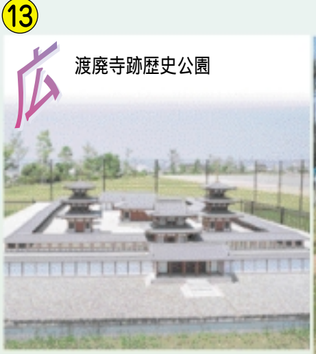
13 広 渡麿寺跡歴史公園

7世紀後半頃に建立された古代寺院跡で、東西両塔、金堂、講堂などが確認され、奈良の薬師寺と同じ伽藍配置であったことが明らかになっています。建物が約20分の1で復元されています。