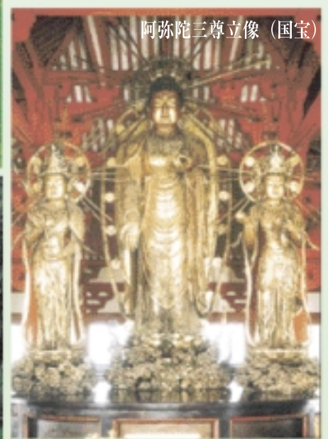
阿弥陀三尊立像 (国宝)