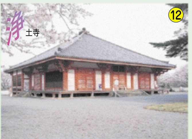
12 浄 土寺