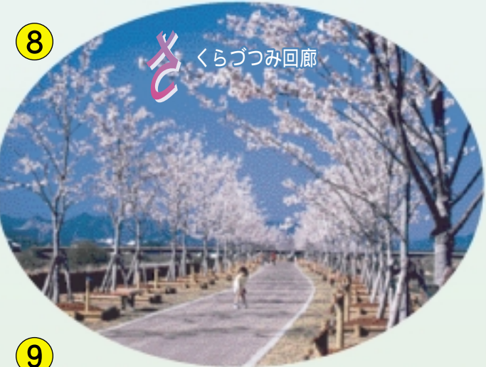
8 さくらづつみ回廊

青野ヶ原台地に築かれた中世の山城。一部が復元され、往時の姿を知ることができます。