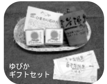
ゆびか ギフトセット