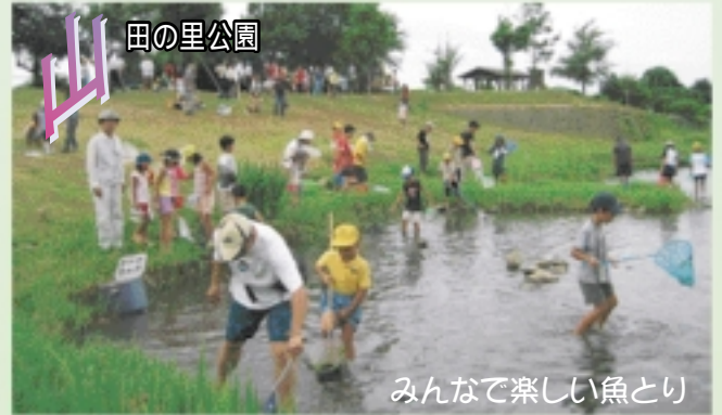
7 山 田の里公園