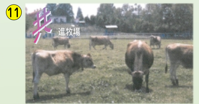
11 共 進牧場