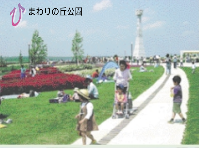
9 ひ まわりの丘公園