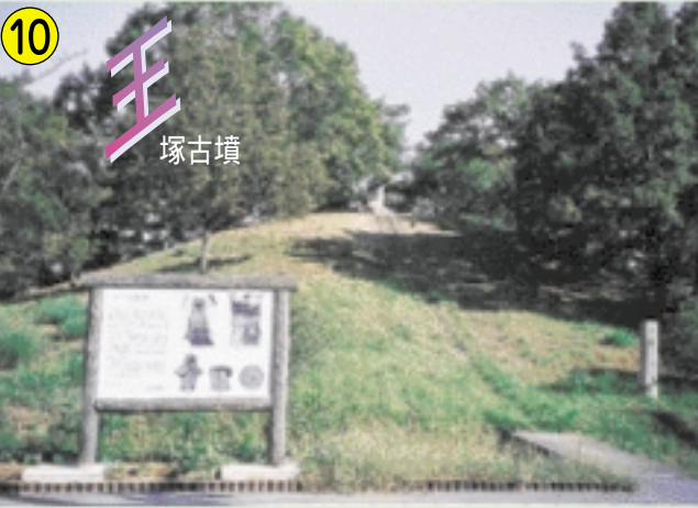
10 王 塚古墳