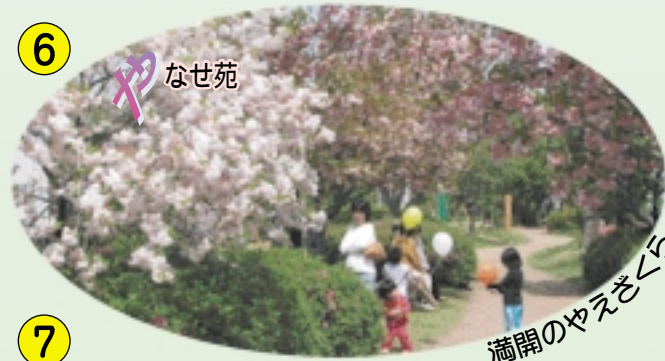
6 や なせ苑