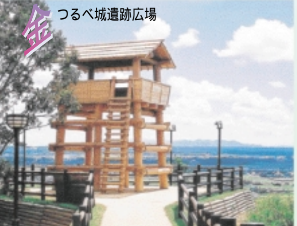
金 つるべ城遺跡広場

青野ヶ原台地に築かれた中世の山城。一部が復元され、往時の姿を知ることができます。