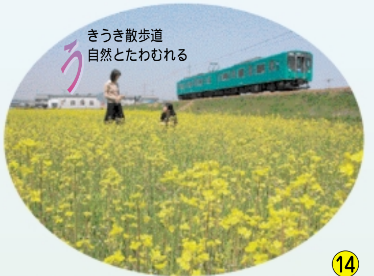
ろう きうき散歩 自然とたわむれる

ふだんにげなく目にしている風景も、ゆっくり歩いてみれば、また違った魅力があるかも知れません。一人でのんびり、または気の合う友人やご家族と、心地よい風を楽しみながら、新しい小野市の魅力を見つけてみてください。