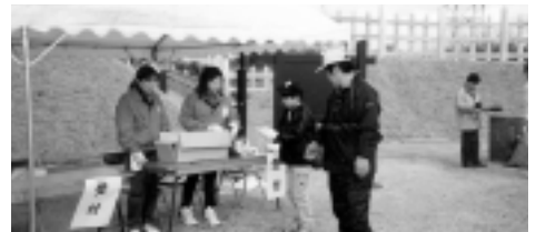
河合地区住民による防犯笛啓発運動

平成16年度、市内において、声かけや露出行為など、確認したものだけでも約50件が報告されています。 子ども達を取り巻く環境は、決して安全ではないことを私達一人ひとりが認識する必要があります。 かわい地区青少年健全育成会では、地域で子どもを見守る運動の取り組みの一環として、防犯笛啓発イベントを