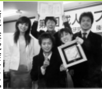
受賞を喜ぶ実行委員会メンバーら(東京・日本青年会館 3月25日)