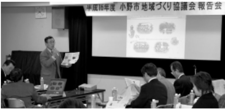
地域づくり協議会報告会

各地区(6地区)の協議会委員約50人が集い、各地区の会長がパワーポイントや冊子を利用して、各地区自慢の自主事業を発表しました。各地区が相互に刺激しあい、17年度に向けて一層意欲が高まりました。各地区地域づくり協議会の自主事業に参画協力した市民の皆さんは、延べ26,000名にものぼりました。