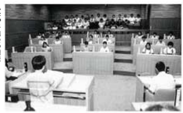
小学っ子議会の模様

市内8小学校の6年生の児童を対象にした「小学っ子議会」を7月24日(木)に開催しました。