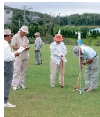
グランドゴルフ大会