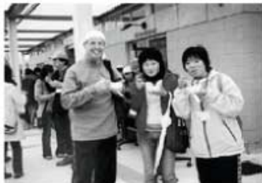
前回の外国人とのふれあい会

場所 市立好古館 参加料 無料 申し込み・問い合わせ 国際交流協会事務局(市民サービス課内) ☎631013・ファクス631047)