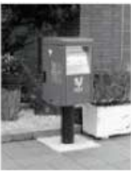
設置された郵便ポスト

以前より来館者が多いことから要望をしておりました郵便ポストが、7月に図書館玄関前に設置されました。どうぞご利用ください。