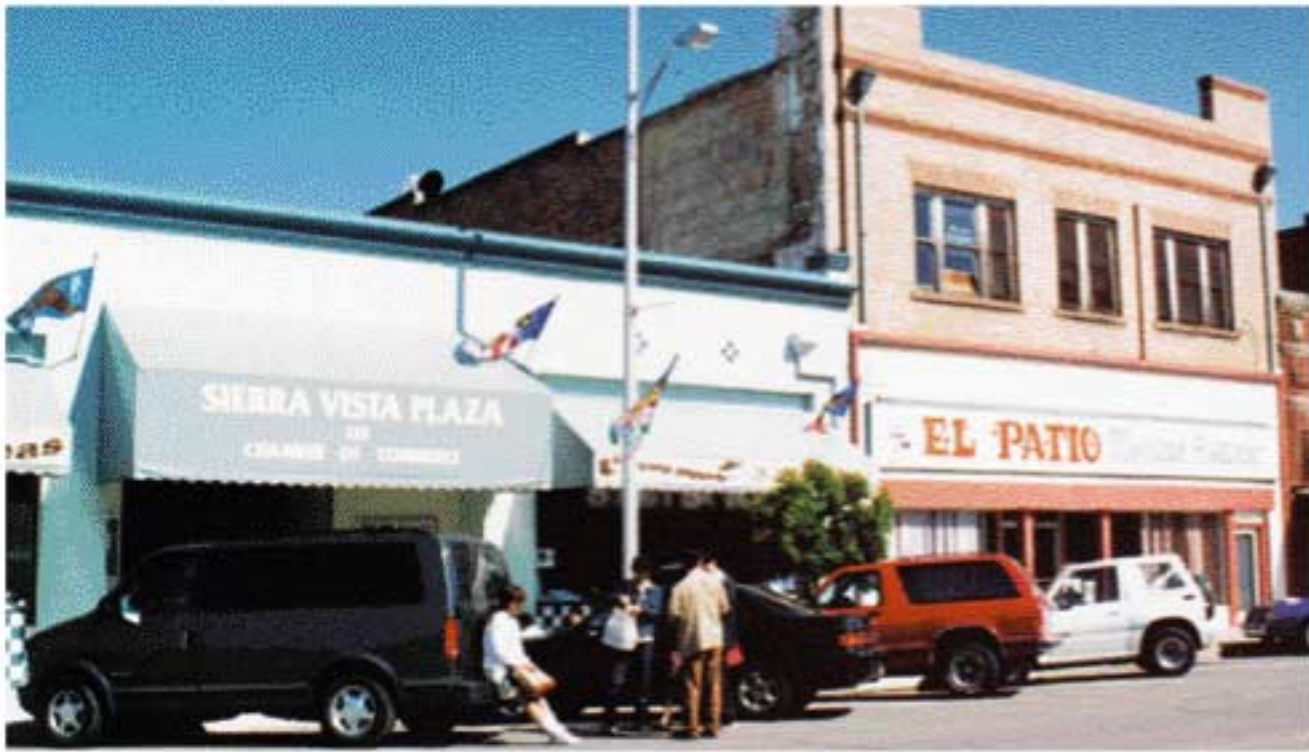
リンゼイ市の街なみ

リンゼイ市は、カリフォルニア州テューレア郡に属し、サンフランシスコの南394km、ロスアンゼルス市の北275kmの位置、車で約4から5時間のところにあります。人口は8,895人。気候は温暖で産業はオレンジ、オリーブ、かんきつ類の栽培が主でカリフォルニア州の主産地となっています。街並みは、低い建物が多く、家のほとんどが一階建てでカラフルです。街を離れるとオレンジ畑やオリーブ畑の連なるのどかな風景になります。メキシコ料理や中華料理、日本食の店も並び、色んな人種の国“アメリカ”を感じる事ができます。学校は、市内に4年制高校