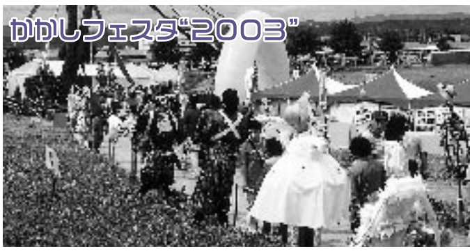
昨年のかかしフェスタから

歩くコースは自由ですが、今まで歩いてきたコースをお友達と歩いて、50km完歩証のあいているところを完成させてください。 コース図の配布(前日から)