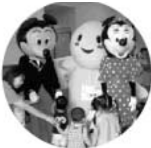
はばタンたちもお出迎え