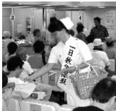
昨年の、1日救急隊長から

9月7日から13日まで救急医療週間です。「命を救うのはあなた」をテーマに、救急医療に関する行事を実施します。なお、1年間を通して救急講習会は受け付けていますので、気軽に申し込みください。 問い合わせ 小野市消防署 (☎630119) 救急キャンペーン 一日救急隊長(小野市民病院看護師)による救急広報 日時 9月9日(火) 10時から