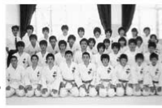
小野高等学校空手道部