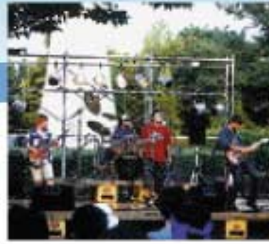
アマチュアバンドライブ