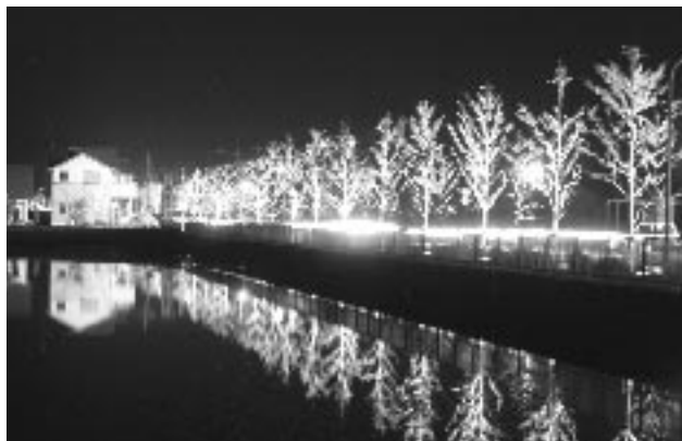
きらら通りのライトアップ

社団法人照明学会の関西支部の関西照明技術普及会により現地審査を経て、平成14年度の優秀な照明施設として、当市のきらら通り「ひかりのプロムナード」が関西照明技術普及会賞に輝きました。関西地区では41件が受賞されています。