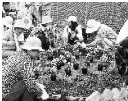
グリーンアート研究会