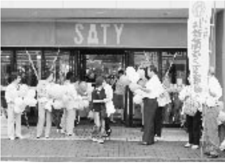
サティでの街頭宣伝活動

第53回社会を明るくする運動の一環として、市・保護司会・更生保護婦人会が7月1日(火)小野サティの出入口で街頭宣伝活動に取り組みました。