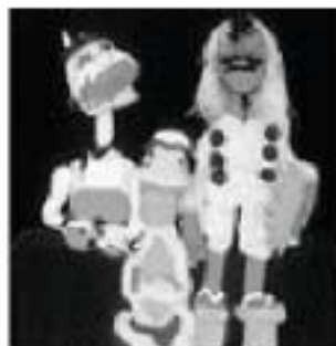
「カップとてんぐとかみなりどん」

がお迎えます。 日時 8月12日(火) 10時20分 場所 児童館「チャイコム」 イベント内容 10時20分 オープニング開始 ぬいぐるみ人形がお出迎え 10時30分 どんぐり劇場公演 「カップとてんぐとかみなりどん」ほか 13時から14時 映画放映