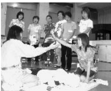
平成14年の救急教室から

☎ 63 0119 ファクス 63 6699 Eメール syobo@city.ono.hyogo.jp