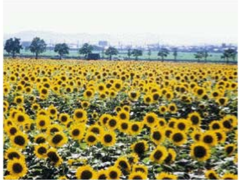
昨年のひまわり畑の「ひまわり」