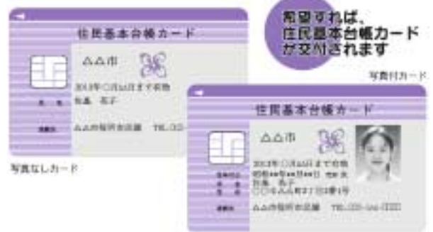
高度のセキュリティ機能を備えたICカードを採用します

受付 8月25日（月）から 交付手数料 500円 交付対象 希望する市民の 方（外国籍の方は、除きます） カードの有効期限 交付の 日から10年間