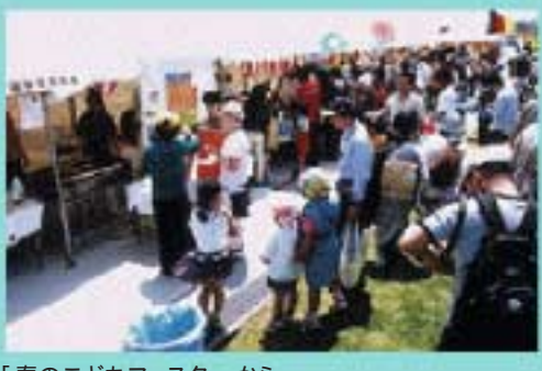
「春のこどもフェスタ」から

ひまわりの丘公園では、「春のこどもフェスタ」につづき、8月16日(土)に「夏のひまわりフェスタ」を開催します。市内・市外の11団体の出店による「ふれあい屋台村」、餅つき大会や焼きそば、ざるそば、たこ焼きなど縁日を演