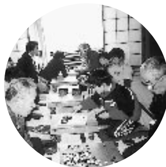
みやま荘囲碁クラブ