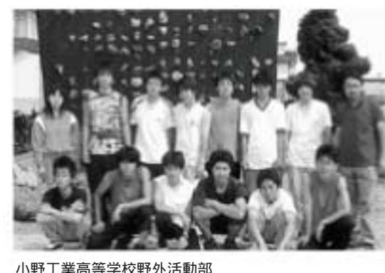
小野工業高等学校野外活動部