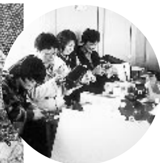
家庭で出来る リサイクルの会

教育委員会コミュニティ課 では、心豊かなひとづくり、 まちづくり、輪づくりを目的 として、自主的な活動グルー プを応援していきますので、