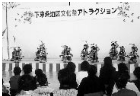
コミセン下東条運営協議会