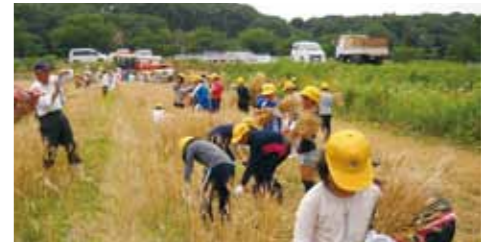
麦の収穫で活気づく水辺の楽校

校歌には、「土と人とに恵まれて みなもと遠きわが市場」と歌われています。このように市場小学校は、豊かな自然、温かみのある地域の人たち、古い歴史と伝統に支えられ、今後も歩み続けていきます。