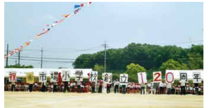
みんなで創立120周年を祝った運動会

5月26日、創立120周年を記念した運動会を行いました。児童の力強い演技に加え、PTA手作りによるパネルで児童、保護者、地域の人たちの心がひとつになることができました。