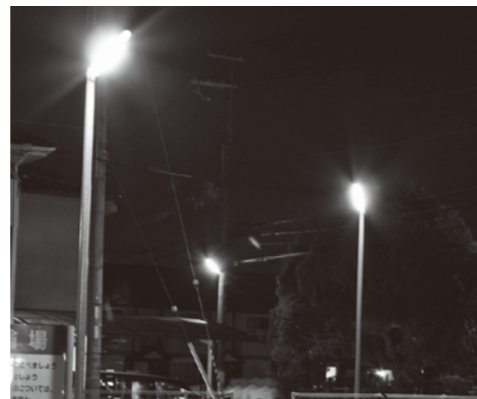
西本町に設置されている防犯灯

自治会内で協議のうえ、区長と防犯協会支部長の連名で、必要書類とともに申請書を提出してください。