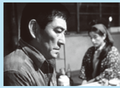
「遙かなる山の呼び声」

① 13:00~ ② 19:00~ 1967年 米国 監督:テレンス・ヤング 出演:オードリー・ヘプバーンほか