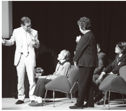
トークショー(前回)の様子

第二の成人式「エイジ・ルネサンス・パーティー2013」を、来年1月に開催する予定です。 この事業は、65歳の方を対象に、いつまでも夢と喜びあふれる「生涯青春」の実践を目指して、新たな出会いの中で自分を再発見し、心豊かな生活と積極的な社会参加の第一歩につなげていただくことと開催しています。