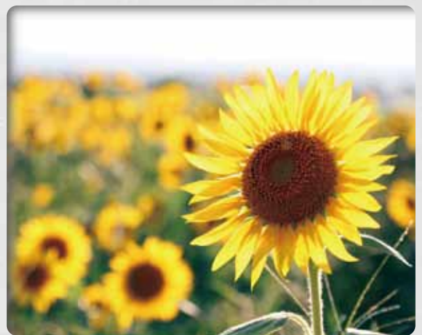
太陽を背に輝くヒマワリ ひまわりの丘公園南側の農地で(昨年8月)