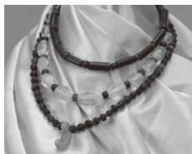
大池7号墳出土の首飾り(三木市)

古墳時代後期(6～7世紀)に造られた古墳といえは、石で作った部屋の中にお棺を納めるといふ横穴式石室が有名です。しかし、小野市の古墳は、古墳上に掘った穴の中に、直接お棺を納める木棺直葬が大半です。木棺直葬は古い埋葬方法を受け継いだもので、1か所に集中して造られ、1つの古墳に数体の埋葬が行われることに特徴があります。