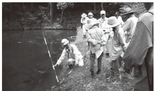
台風や大雨によるため池の災害を未然に防止するため、管理者による日ごろの点検管理や防災体制を整備しておくことが大切です。