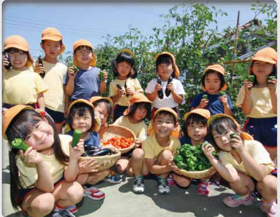
おいしい夏野菜とれたよ (来住保育所で)