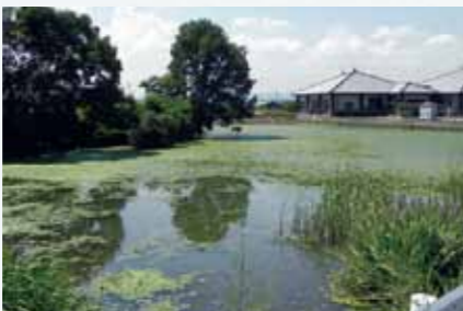
重源の伝承が残るにぎり池(浄谷町)

再び東大寺領となるのは1192年で、重源の指導の下、「鹿野原」(浄谷、中島、黒川、広渡町あたり)と呼ばれていた原野の開発が進められた。水利の悪い台地上にあったため、治水灌漑が必要で、重源がため池をつくり、開墾が進んだという伝承が残る。浄土寺南西の地蔵池(濁り池)もそんな重源伝承の池だ。浄土寺の真西の北池なども大部荘開発にかかわるものとされている。