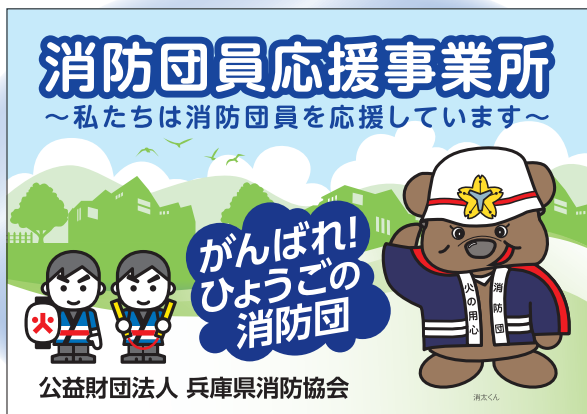
▲消防団員応援事業所ステッカー

自分たちのまちは自分たちで守る」をモットーに、地域で活動している消防団員を地域全体で応援する事業です。