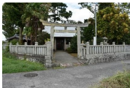
顕王神社（2020 年9月撮影）

今月は、小野市高田町にある顕王神社にまつわるお話しをご紹介します。祭神は、顕宗天皇（弘計・ヲケ）であり、兄・仁賢天皇（億計・オケ）とともに語られることが多い存在です。二人は、父の市辺押磐王を雄略天皇に殺害されたことを契機として、逃亡して志染に潜伏していました。ところが、雄略天皇の後、清寧天皇が即位しましたが後継者がなく、皇位断絶の危機が生じました。そこで、一旦、市辺押磐王の妹・飯豊青皇女が政治を取り仕切り、潜伏していたオケ・ヲケ皇子を見出して天皇に即位させたのです。 『播磨国風土記』では、根日女命の伝承に登場します。根日女命の二〇二五年九月号でも少し紹介した賀茂郡檜原里の「玉野の村あり」として次のようなエピソードが記されています。 オケ・ヲケ皇子は、志染里の高宮にいた。山部小楯がやってきて、国造許麻の娘の根日女命に求婚を申し込ませたところ、根日女命はこれを承諾しまし