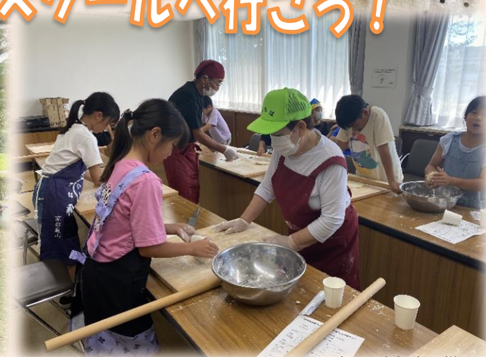
写真は、昨年度の様子です