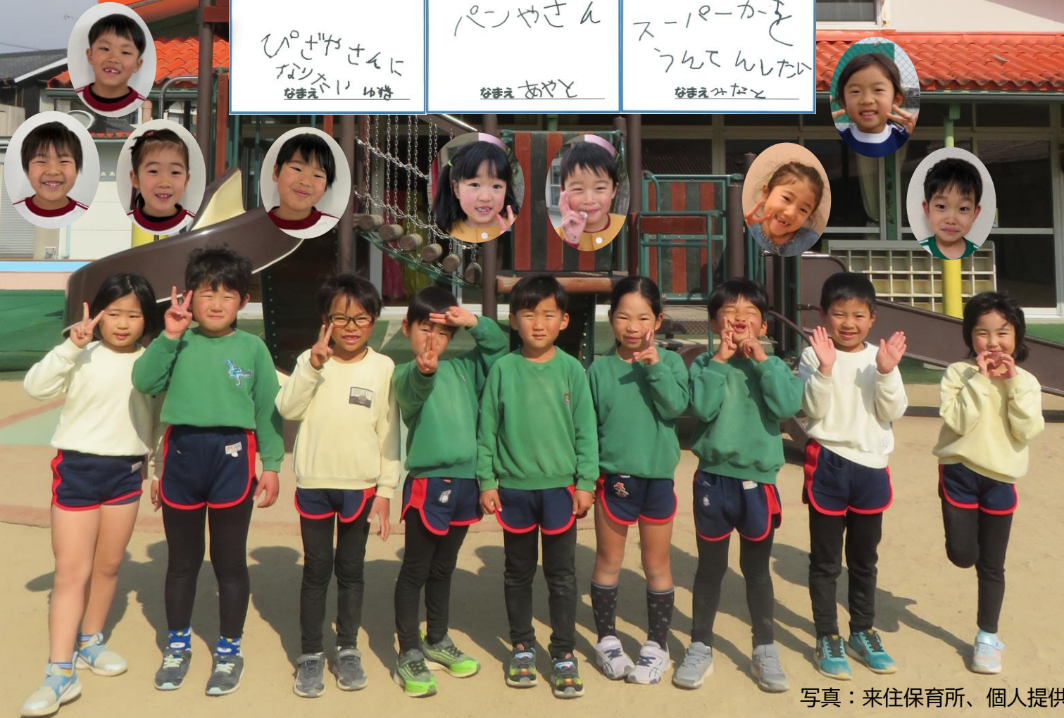
写真：来住保育所、個人提供