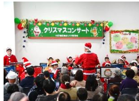
クリスマスコンサート