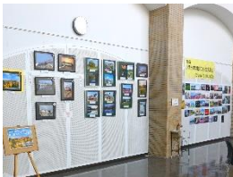
粟生線フォトコンテスト