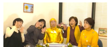
人権ビデオ 「100年のバトンを受け継ぎ、そして未来へ」