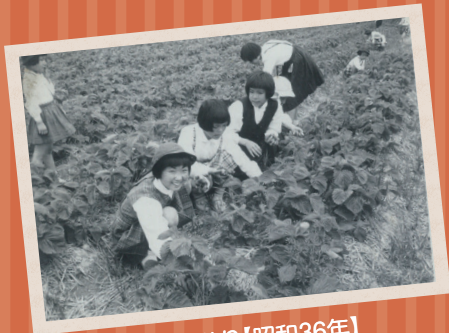
いちご狩り【昭和36年】