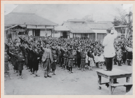
小学校での歯磨き講習会【昭和6年】