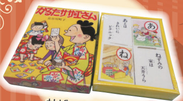
サザエさんかるた