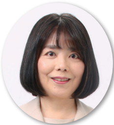
俵 万智 (たわら まち)

昭和37年大阪府に生まれる。早稲田大学第一文学部日本文学科卒業。「心の歌」会員。歌集に『サラダ記念日』（現代歌人協会賞）『プーさんの鼻』（若山牧水賞）『未来のサイズ』（詩歌文学館賞、超空賞）など。評伝『牧水の恋』（宮日出版大賞特別大賞）、新書『生きる言葉』など多数。連作『白き父』（短歌研究賞）、朝日賞、紫綬褒章。