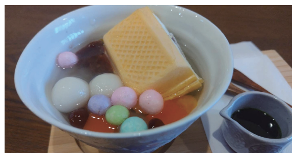
ふるさとカフェお茶〇ん アイス白玉あんみつ ￥800