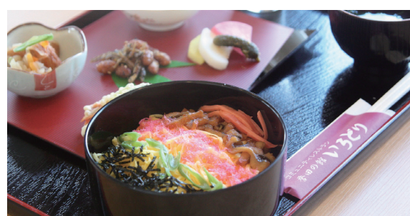
誉田の館いろどり ひな御膳 ￥1,200