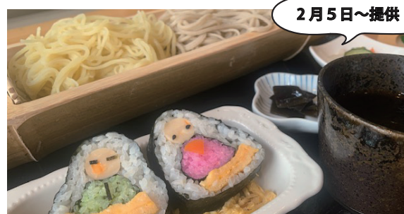
ぷらっときすみの・2号店 ひなそば御膳 ￥1,300