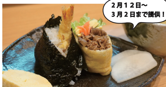
おにぎり屋まごいち ひな祭りおむすびセット ￥1,300