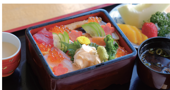
小野向日葵ホテル ひな祭り膳 ￥2,000