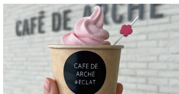
CAFÉ DE ARCHE ひなソフト ￥480