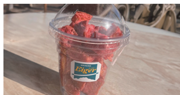
BÄCKEREI CAFÉ Eiger 小野店 ひなラスク ￥330