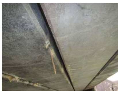
床板に遊離石灰が見られます