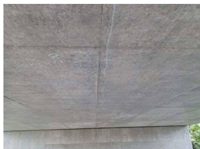
主桁にひびわれが見られます