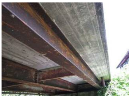
主桁に腐食が見られます