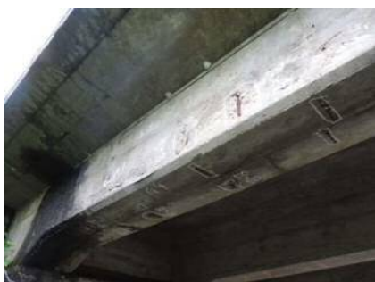
主桁に剥離が見られます