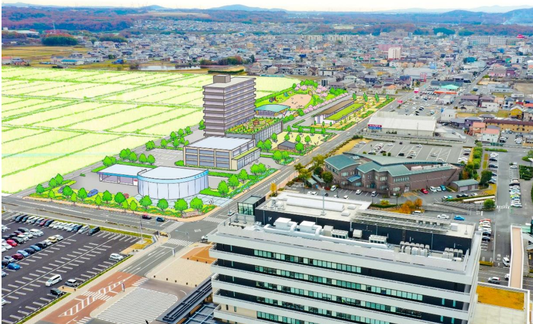
市街地イメージ図

このたび、土地区画整理事業による開発に向け、（仮称）図書館東地区土地区画整理事業準備検討会を立ち上げ、本格的な市街地開発の実現に向けて取り組みを進めています。