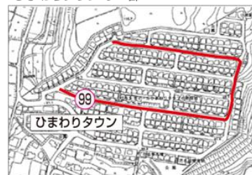
9 ひまわりタウンルート 10 中谷ルート