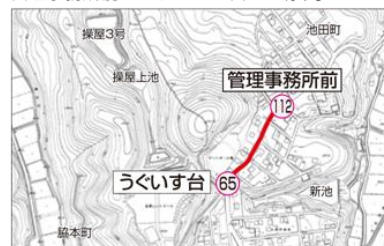
9 ひまわりタウンルート