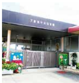
下東条中央保育園