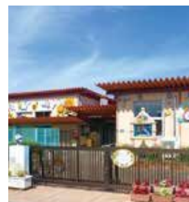
小野ひまわりこども園