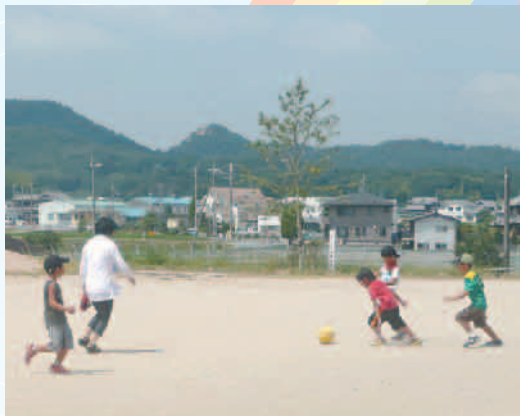
【夏休みのアフタースクールのひとコマ】