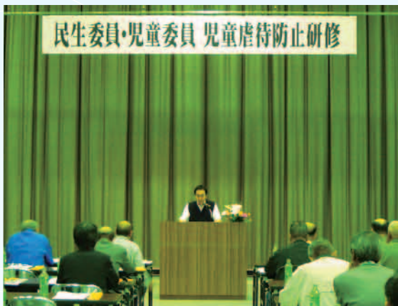
【児童虐待防止研修】