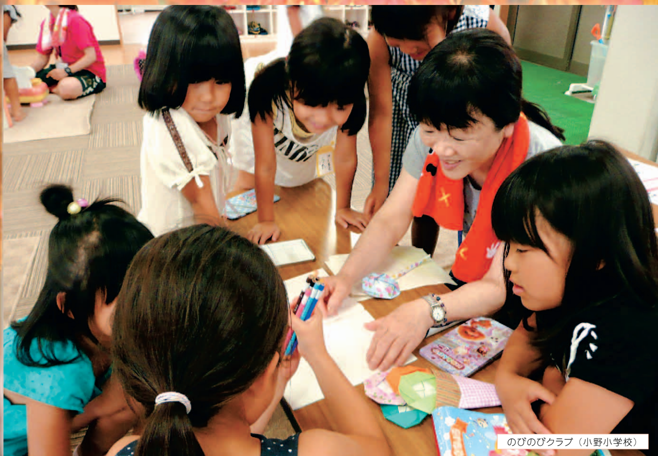
のびのびクラブ (小野小学校)