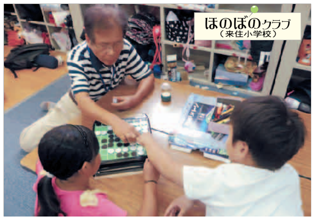
ほのぼのクラブ (来住小学校)

▼部屋に入ると「民生委員さんですよ」と紹介され、子ども達がしている昆虫トランプを見ていました。みんなとても早く、私だったら一枚も取れなかったと思います。また、体育館では汗だくになってにぎやかに駆け回ってボール遊びをしている子ども達。 短い時間ではありませんでしたが、沢山のパワーをもらったひと時でした。