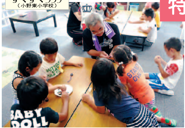
すくすくクラブ (小野東小学校)

▼今回、二回目のアフタースクールに参加させて頂きました。沢山の子ども達が利用しているのに驚きました。元気一杯の挨拶を受け、女の子達と花札で遊んでいました。男の子もよって来て、百人一首で坊主めくりをしました。子ども達も勝ちを意識して必死です。あつという間の一時間でした。夏休みの楽しい思い出の一つになったらしいなと思います。