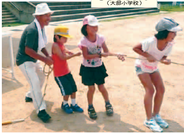
きらきらクラブ (大部小学校)

▼アフタースクールに参加して二年目、今年は二回の参加をしました。昨年の参加も覚えてくれており、快く受け入れてもらったことは、「一緒に遊ぼう」という言葉に表れています。二回の参加を通じて、徐々に通じ合うものが芽生えてきたのかなと感じています。 これからは、さらに私達が如何に子ども達に溶け込んでいけるかだと思っています。