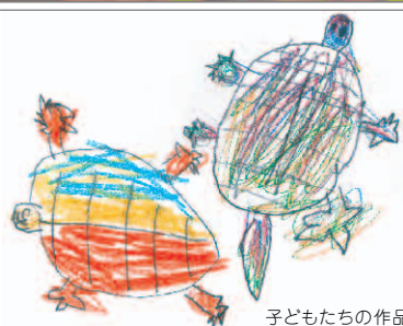
子どもたちの作品