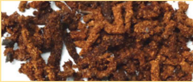
クビアカツヤカミキリのフラス