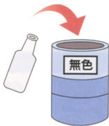
無色のびん (白色・透明)