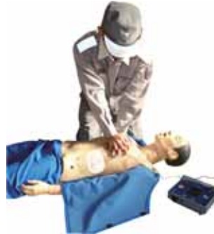
ただちに胸骨圧迫を再開

■電気ショックが完了すると、「ただちに胸骨圧迫（心臓マッサージ）を開始してください」などの音声メッセージが流れますので、これに従って、ただちに胸骨圧迫を再開します。