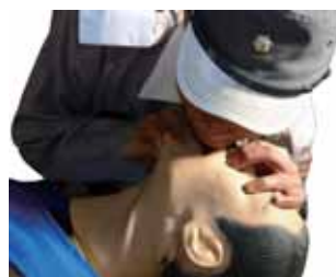
胸が持ち上がるのを確認