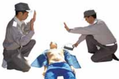
解析中は音声メッセージに従い離れる

■電極パッドを貼り付けると「体に触れないでください」などの音声メッセージが流れ、自動的に心電図の解析が始まります。このとき、「みなさん、離れて」と注意を促し、誰も傷病者に触れていないことを確認します。