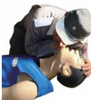
「見て」「聞いて」「感じて」

■気道を確保した状態で、自分の顔を傷病者の胸に向けながら、頬を傷病者の口・鼻に近づけます。