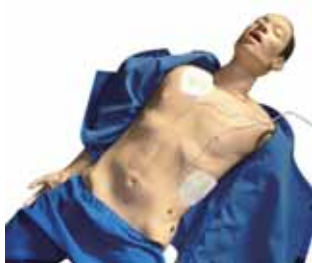
電極パッドを貼り付ける位置