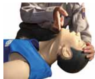
頭部後屈あご先挙上法

■片手を額に当て、もう一方の手の人差指と中指の2本をあご先に当て、頭を後ろにのけぞらせ（頭部後屈）、あご先を上げます（あご先挙上）。