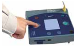
ショックボタンを押す