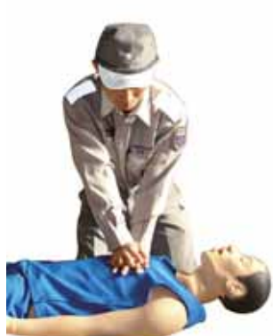
胸骨圧迫（心臓マッサージ）

2回の人工呼吸が終わったら、あるいは省略することにしたなら、ただちに胸骨圧迫を開始し、全身に血液を送ります。